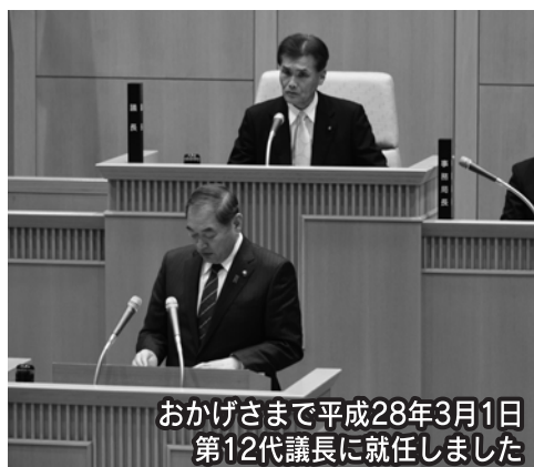
おかげさまで平成28年3月1日 第12代議長に就任しました