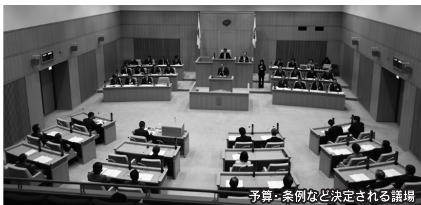
予算・条例など決定される議場